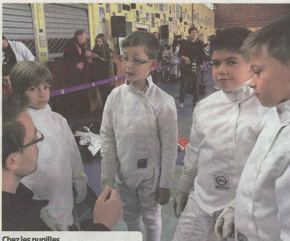
Chez les pupilles L'équipe 2 d'Arras s'impose devant Grande Synthe et Valenciennes.